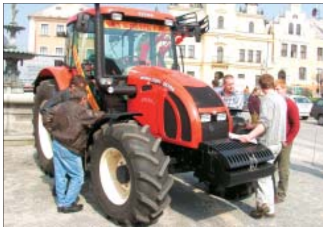
Model 117 41.4c je s výkonem 90 kW nejvýkonnějším zetorem se čtyřválcovým motorem