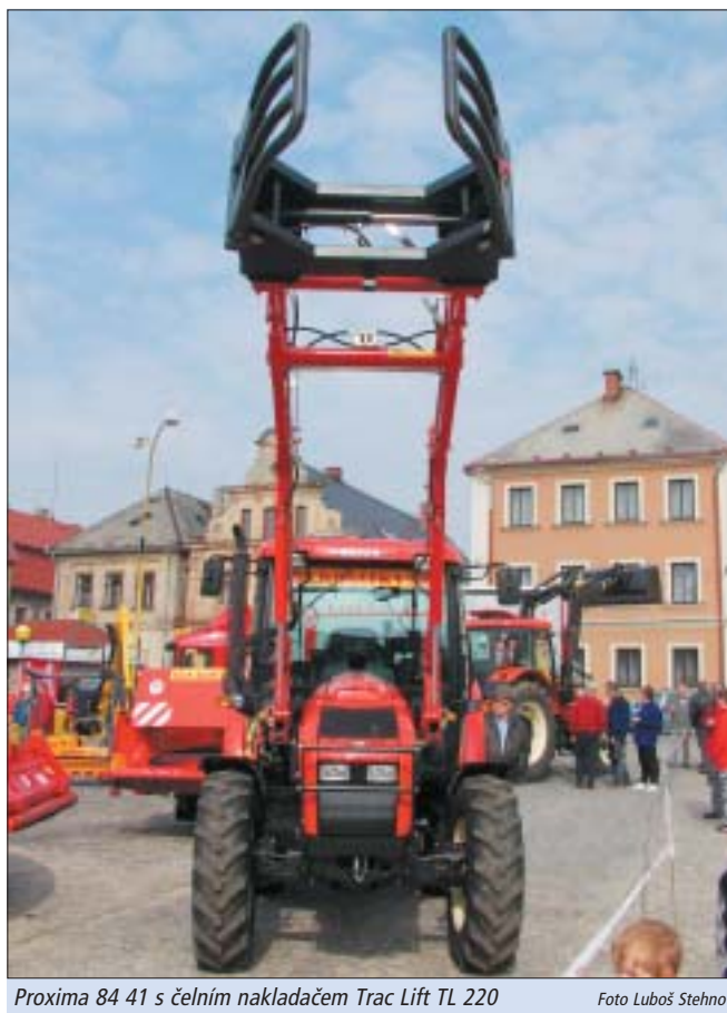
Proxima 84 41 s čelním nakladačem Trac Lift TL 220

Další závěsná technika již nebyla od domácích výrobců, ale od společnosti Kverneland Group. Záběr této firmy je velmi široký a nabízí techniku pro zpracování půdy (konvenční i bezorebné), sečí stroje, techniku pro sklizeň pícnin, postřikovače, sklízecí hroznů i brambor, rozmetadla