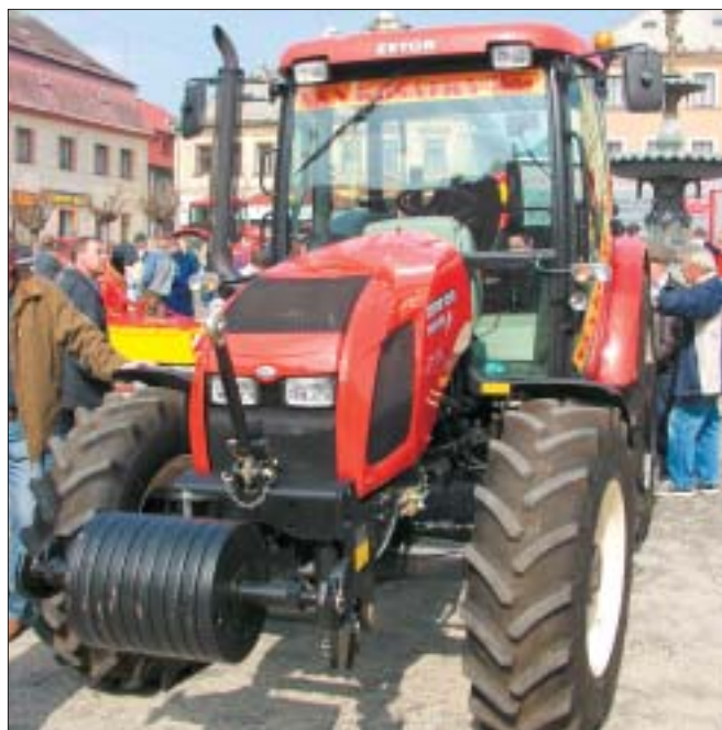
Proximu Plus 105 41 jsme mohli vidět poprvé i za jízdy, i když zatím ne v agregaci s nářadím