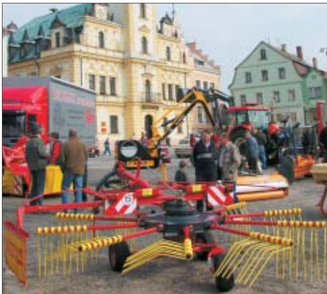
Nejen na poli lze pořádát předváděcí akce. V popředí je jednorotorový shrnovač SB 401 ze Strojírny Rožmitál

Ačkoli v Hodkovicích nad Mohelkou nešlo o polní předvádění, návštěvníci o akci projeví zájem. K praktickému předvádění zetorů byl přizván i týdeník Zemědělec. Jen po usednutí do kabiny bylo i bez ježdění zřejmé, že traktory v technické úrovni postoupily zase o stupínek výš. Snad jen použití světlejších plastů v kabině není zcela ideální,