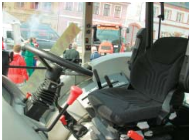
Nové umístění páky reverzace v traktorech Proxima Plus