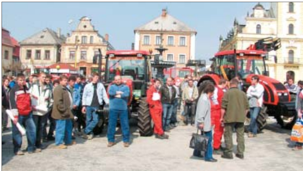
Účast návštěvníků na předváděcí akci byl hojná, hlavním tahákem byly nové zetory

Produkty Humpoleckých strojů byly montovány na dvou traktorech. Nakladač řady TL360 na traktoru Zetor 117 41 Forterra a model z řady TL 220 na modelu 8441, což je zástupce z nižší výkonové řady Proxima.